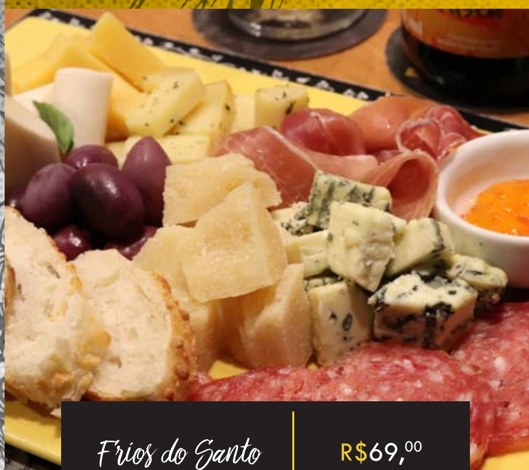
Frios do Santo