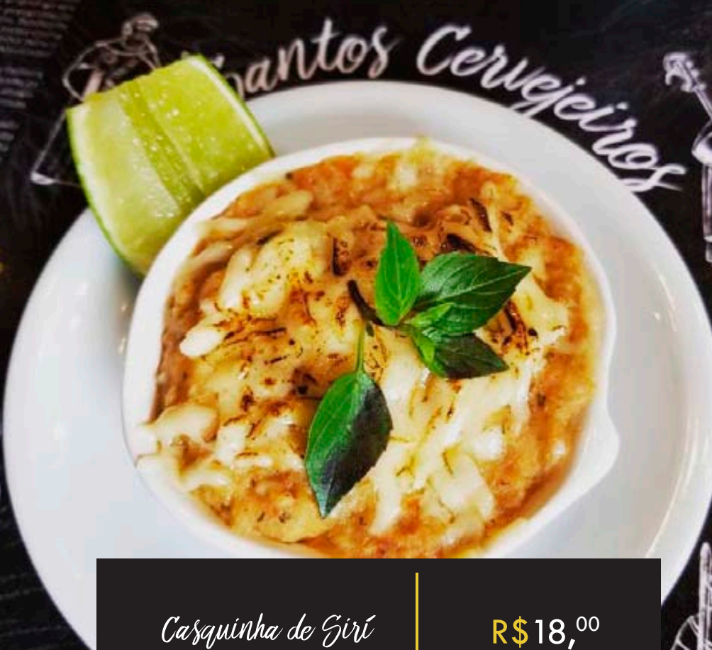
Casquinha de Gíri