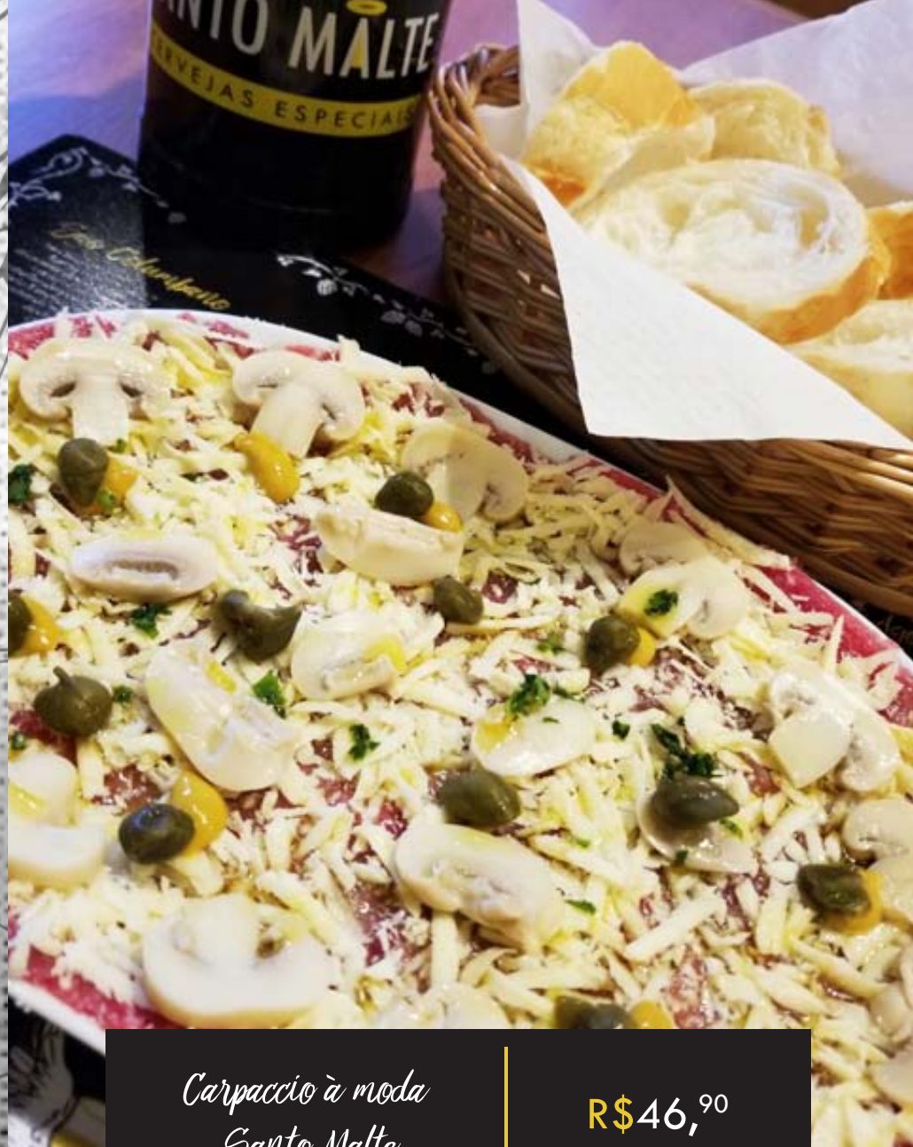
Carpaccio à moda Santo Malte