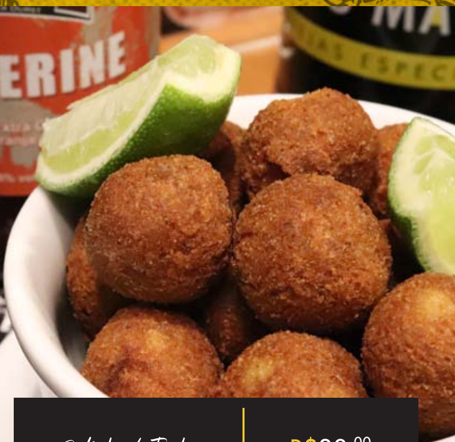
Bolinho de Truta