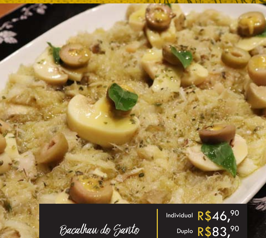
Bacalhan do Santo